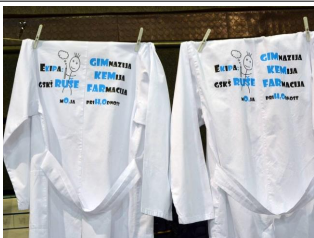
Slika: Oprema dijakov

Naši kemiki zanje s področja kemijske stroke izkazujejo na državnih tekmovanjih, najboljši v državi pa tudi na mednarodnem tekmovanju.