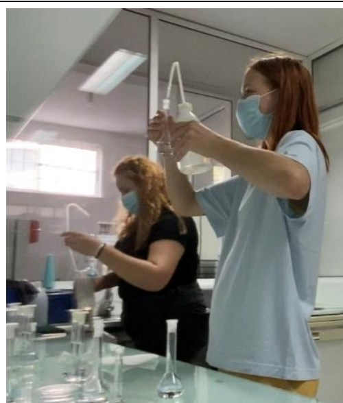
Slika: Erasmus+ praksa na Portugalskem

Gimnazija in srednja šola za kemijo in farmacijo ima sodobno opremljene laboratorije, kar dijakom omogoča usvajanje znanja za poklic kemika. V okviru mednarodnega projekta Erasmus+ je dijakom omogočeno opravljanje prakse v tujini. Šola sodeluje s podjetji kemijske stroke, saj dijaki pri njih opravljajo redno šolsko prakso. V zadnjih letih so za bodoče kemike razpisane kadrovske štipendije.